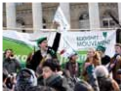
Mobilisation pour la taxe Robin des bois