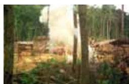
Barrage détruit du peuple Penan en Malaisie

la bannière des PRI (Principes pour l'Investissement Responsable des Nations Unies). Ils sont plus de 800 dans le monde, pèsent ensemble plus de 30 000 milliards de dollars et ont un point commun : ils se sont engagés à tenir compte de critères Environnementaux, Sociaux et de Gouvernance (ESG) dans la gestion de leurs actifs. L'un des moyens de le faire consiste à interpellier les entreprises dont ils sont actionnaires sur ces dimensions. C'est ce qu'on appelle l'engagement. En Europe, cette pratique concernerait plus de 1500 milliards d'euros. Or, si les entreprises s'intéressent en principe aux attentes de leurs actionnaires, elles sont encore très surprises quand celles-ci ne sont pas d'ordre financier. Pourtant, si dans un premier temps, leurs échanges ne sont pas