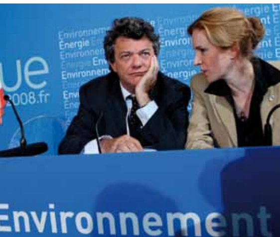
Jean-Louis Borloo et Nathalie Kosciusko-Morizet

Réunir des acteurs de la société civile et des institutions, du monde économique et politique pour négocier sur l'ensemble des sujets qui concernent le développement durable, tel est le pari lancé par Jean-Louis Borloo. Un projet inspiré du Pacte écologique initié par Nicolas Hulot lors des élections présidentielles de 2007.