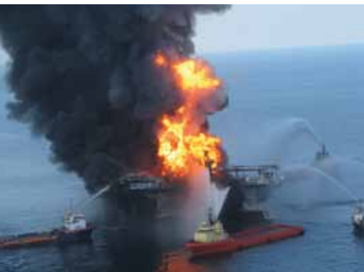
Explosion de la plateforme Deepwater Horizon en avril 2010