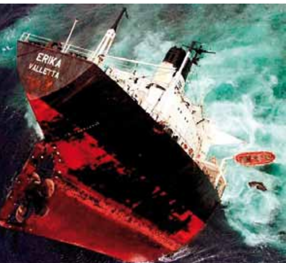
Le naufrage de l'Erika...

Si quelques pays ont adopté des législations contraignantes, l'application de politiques volontaires reste la règle en matière d'impacts sociaux et environnementaux des multinationales.