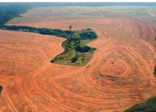
Déforestation au Brésil

Du Sommet de Rio en 1992 à l'événement « Rio + 20 » prévu en juin 2012, la pression sur les ressources naturelles et la notion d'empreinte environnementale sont devenues des réalités, pour une grande partie des populations au nord comme au sud. Pourtant, la protection de la biodiversité est un sujet qui mobilise moins que celui du changement climatique.