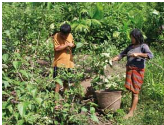
Collecte pour la prospection biologique

temps de la biodiversité parce qu'elles sont soumises à la réglementation, comme les producteurs de béton et granulats, les gestionnaires d'infrastructures ou encore l'industrie cosmétique et pharmaceutique, concernée par le Protocole de Nagoya pour l'accès et le partage des avantages tirés des ressources génétiques. Parmi les premiers signataires, on trouve ainsi Lafarge, Cemex, Yves Rocher, LVMH, Cosmetic Valley, SITA, Suez environnement, Vinci... Des secteurs d'activités pour qui la biodiversité n'est pas une question neuve et dont les activités sont concernées au premier chef.