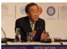
Ban ki moon

Planète \ Environnement \ Réchauffement climatique